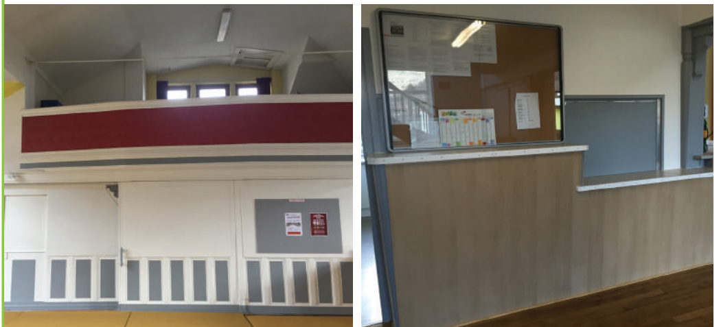
Travaux de peinture et réalisation du comptoir d'accueil - salle de gymnastique