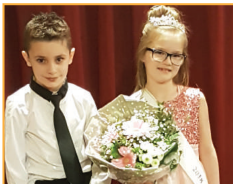
samedi 24 février à 15h Cavalcade des enfants