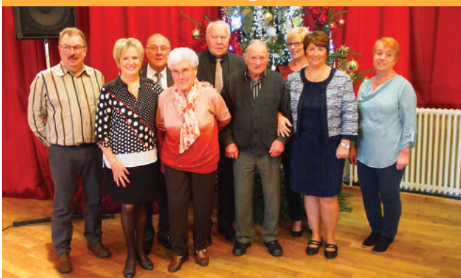
Remise des prix du fleurissement de Buhl