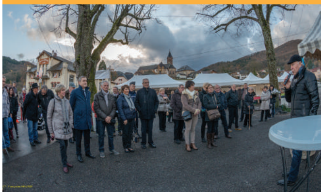
Fête de Noël de l'Age d'Or