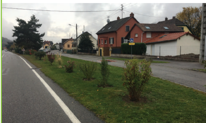
Une haie vive a été plantée à l'entrée ouest de BUHL entre la RD430 et la rue Florival

De nouveaux aménagements paysagers ont été réalisés en régie. Plantations arbustives et pierres minérales ont été implantées pour redonner une nouvelle harmonie visuelle tout en facilitant l'entretien et en limitant l'arrosage.