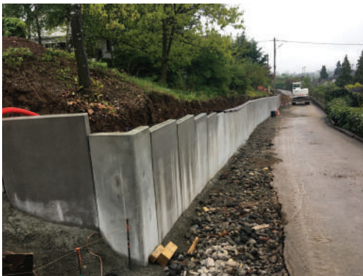
Mur de soutènement pour élargir la voirie et reprendre l'écoulement des eaux pluviales

Cette portion de rue a été aménagée aux normes actuelles notamment en ce qui concerne les réseaux. Elle participe à la future liaison entre la trame verte de Guebwiller et la piste cyclable qui rejoint Lautenbach.