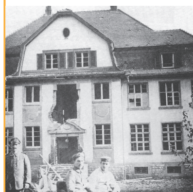
Ecole des filles sinistrée à Buhl