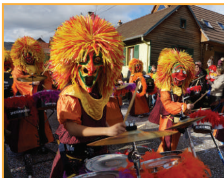
dim. 25 février à 15h Grande Cavalcade