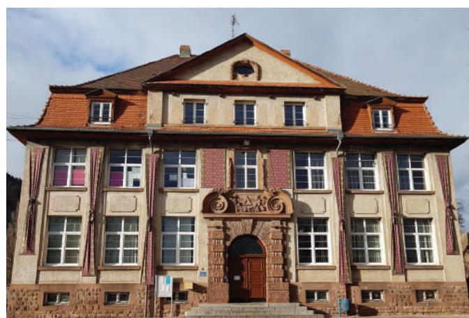
Mise en place de rideaux sur la façade de l'école Koechlin confectionnés gracieusement par une citoyenne buhloise.