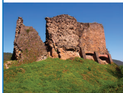
Château du Hugstein

2 507 323€ en fonctionnement et 1 635 832€ en investissement.