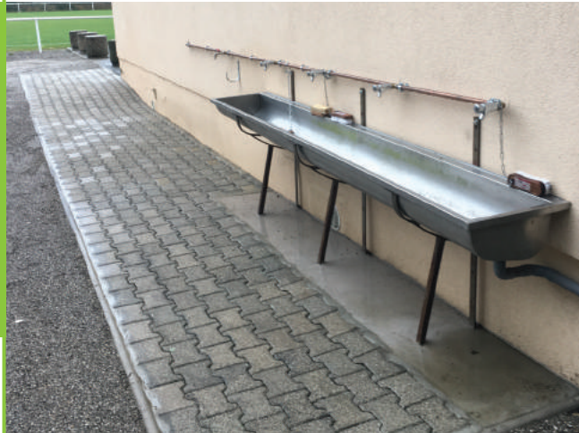
Réalisation d'un point de lavage extérieur au FC BUHL

Tout au long de l'année les services municipaux aident les associations locales que ce soit pour l'entretien de leurs locaux, de nouvelles installations ou pour l'organisation de leurs manifestations.