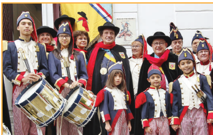
Avec la participation de la République du Montmartre de Paris