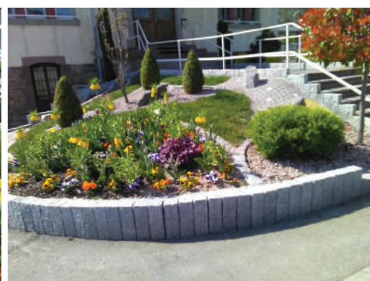
Aménagement devant la salle de gymnastique