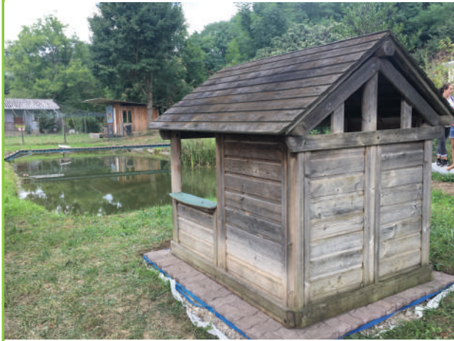
Mise en place d'un cabanon - zone avicole du Montag