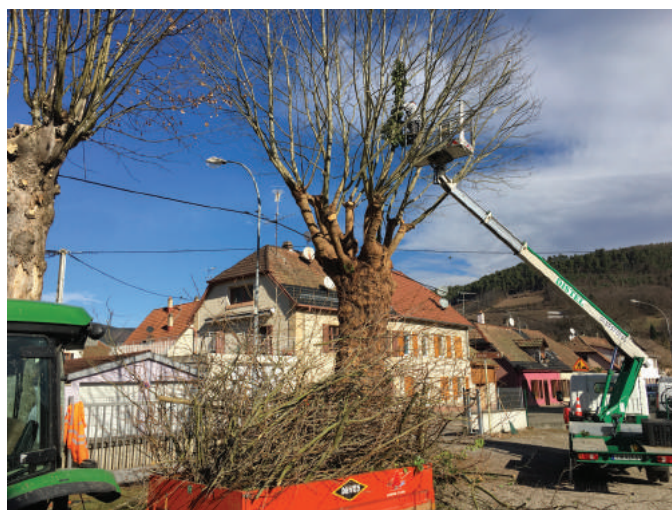
Une nacelle est souvent nécessaire pour réaliser des travaux en hauteur. Ici taille des arbres au Cercle.

1172 heures de tonte et de débroussaillage ont été réalisées en 2017 pour les espaces verts, les terrains du stade, le cimetière et les chemins du vignoble.