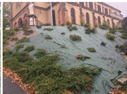
Aménagement butte de l'Eglise