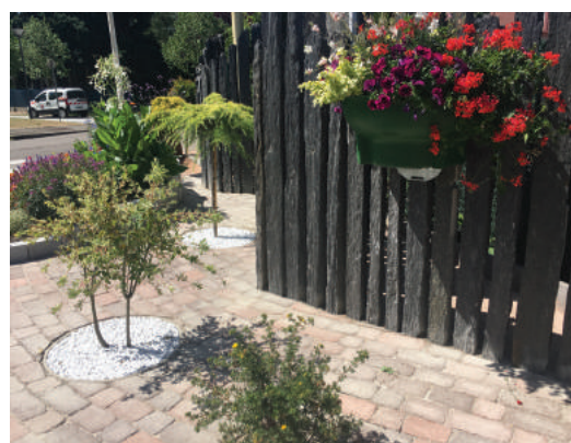
Aménagement au feu vers l'entrée de Buhl