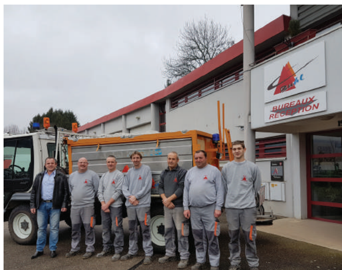
L'équipe du centre technique municipal

Au titre de 2017 plus de 41 000 € de travaux ont ainsi été réalisés pour la mise en valeur du patrimoine communal.