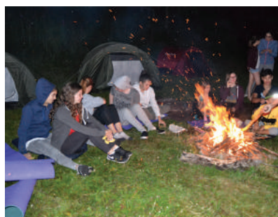
Bivouac sur les Crêtes

Date à retenir : Fête de la musique en famille vendredi 15 juin 2018