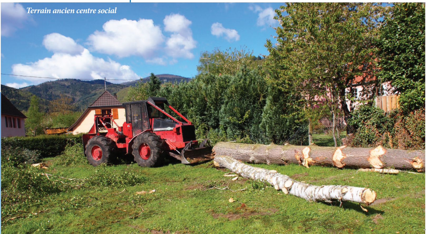
Terrain ancien centre social