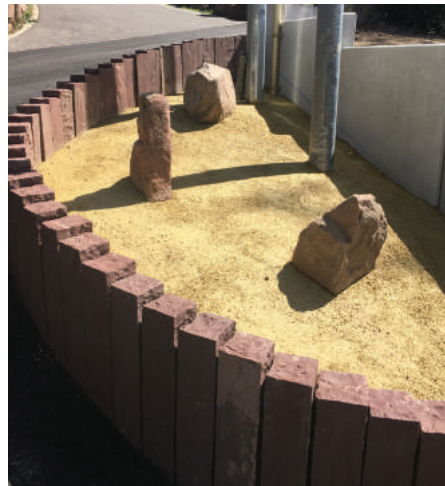
Réalisation d'un îlot avec palissade, pierres en grès et pose d'un mât d'éclairage public