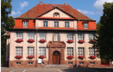
Ecole Maurice Koechlin

Tout au long de l'année les écoles font l'objet de travaux d'entretien et d'investissement pour le bien être des élèves.