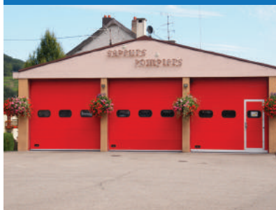
Caserne des sapeurs-pompiers

Depuis le 1 er janvier 2017, le Corps des Sapeurs-Pompiers est départementalisé. Le nouveau Centre de Première Intervention Intégré de BUHL est joignable en composant le 18.