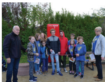
Inauguration de la boîte à livres